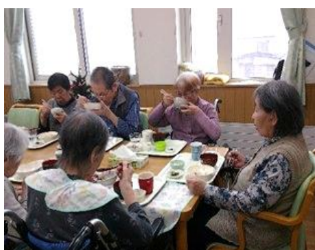
クリスマス昼食会②

クリスマスパーティーを行いました！職員手作りのケンタッキーフライドチキン風ザンギもとっても美味しかったです！