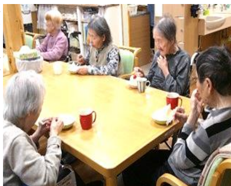
クリスマスケーキ②

「とっても甘くておいしい。幸せ」「ケーキを食べるとクリスマスって感じがするね」と楽しまれました。