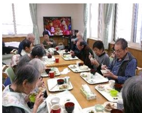
クリスマス昼食会①

クリスマスパーティーを行いました！職員手作りのケンタッキーフライドチキン風ザンギもとっても美味しかったです！