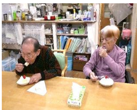
クリスマスケーキ①

午後から体操を行い、その後のおやつの時間にクリスマスケーキを食べました。ショートケーキを頂きました。