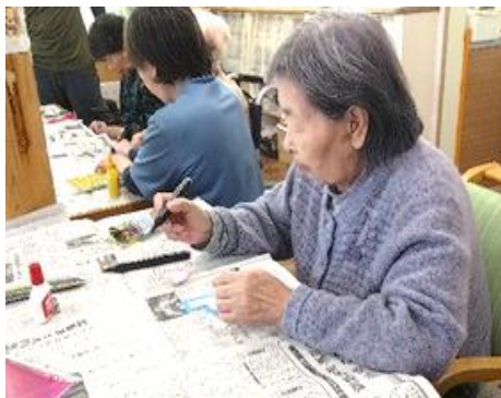
オーナメント作り②

皆さんクリスマスといえば、白・黒・赤・緑・黄色等、色塗りを考えて塗っていました。「可愛くしたいからピンクもいいんじゃないかな？」と頑張っていました。