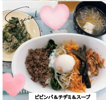
ピビンバ&チヂミ&スープ

毎日、調理員さんが昼食を作っていますが、時々ご利用者様も補助に入ります！出来た昼食は一人一人トレーに乗せ、各自が調理場に受け取りに行きます。