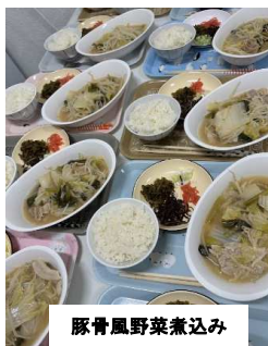
豚骨風野菜煮込み